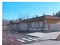
NOTRE DAME DE L'OSIER :

Lundi, mardi, jeudi, vendredi : 8h30-11h30 / 13h00-16h00